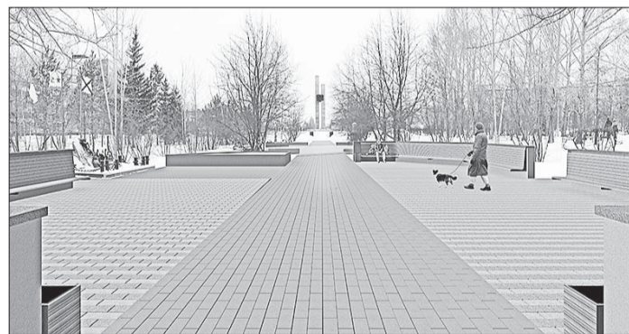
Мемориальные площадки в парке Победы

Ежедневно читайте и смотрите свежие новости города и района на сайте ogni-sibiri.rf .