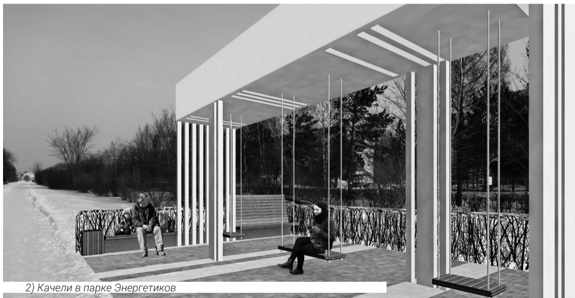
2) Качели в парке Энергетиков