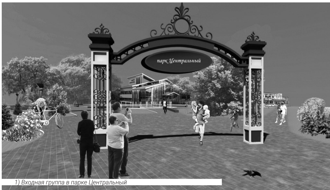
1) Входная группа в парке Центральный