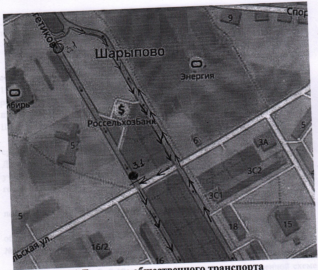
Схема движения автобусных маршрутов № 4П,5,7,9,10 12 июня 2019 года (с 11-40 до 15-00)

ВНИМАНИЕ! Движение общественного транспорта осуществлять по просп. Энергетиков (проезд вдоль 1 мик-она) в двустороннем движении.