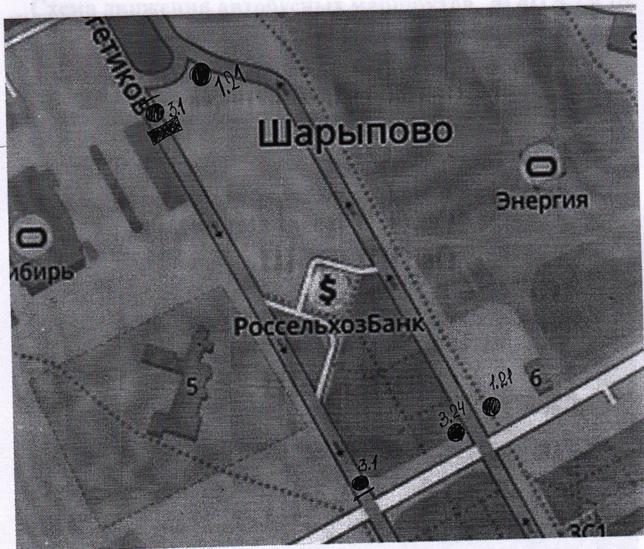
Схема размещения дорожно-знаковой информации 12 июня 2019 года (с 11-40 до 15-00)

Приложение № 1 к распоряжению Администрации города Шарыпово от « 4 » июня 2019г. № 634