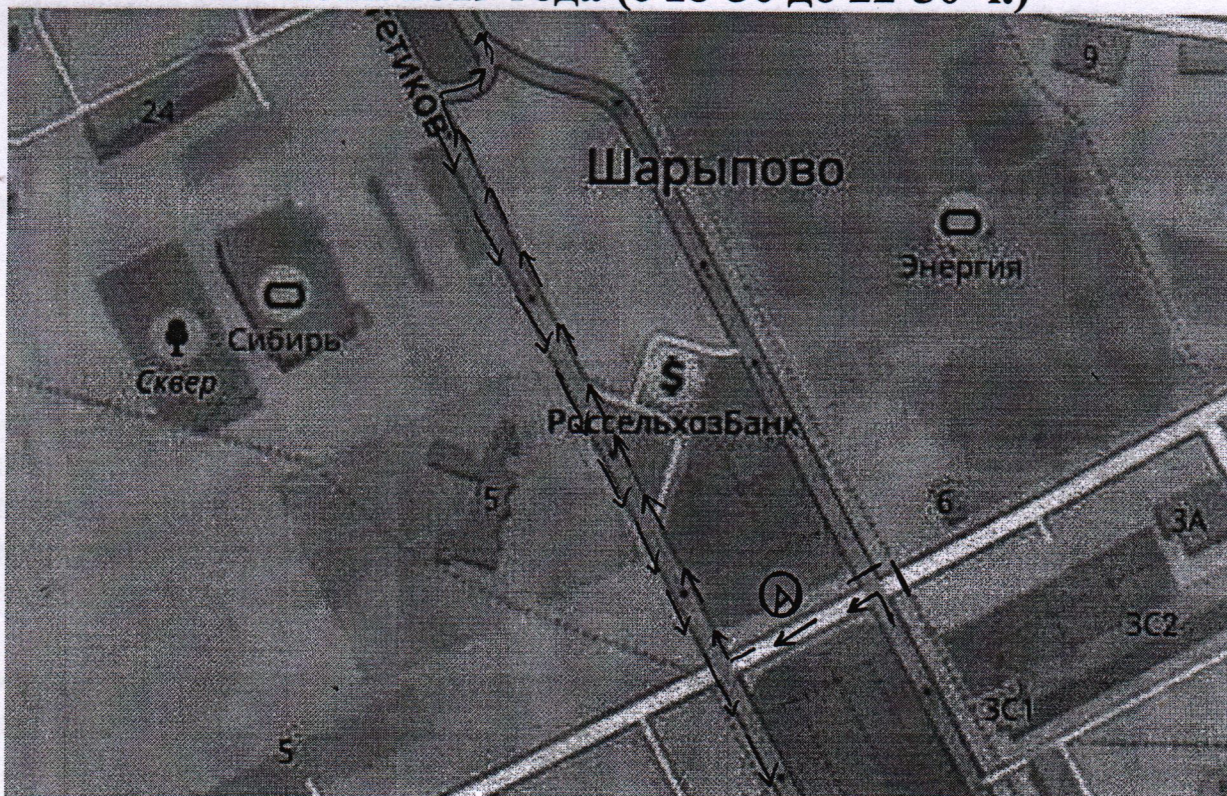
Схема движения автобусных маршрутов № 4П,5,7,9,10 29 июня 2019 года (с 18-30 до 22-30 ч.)

ВНИМАНИЕ! Движение общественного транспорта осуществлять по просп. Энергетиков (проезд вдоль 4 мкр.) в двустороннем движении.