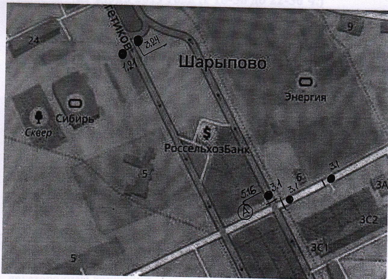
Схема размещения дорожно-знаковой информации 29 июня 2019 года (с 18-30 до 22-30 ч.)

Приложение № 1 к распоряжению Администрации города Шарыпово от « 20 » июня 2019г. № 712