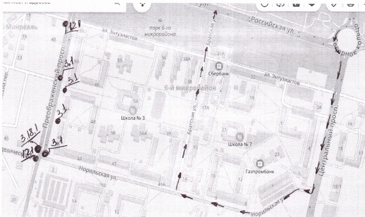
Схема движения автобусных маршрутов № 5,6,7,8 период с 08-00 ч. до 20-00ч. 25 ноября 2018г.