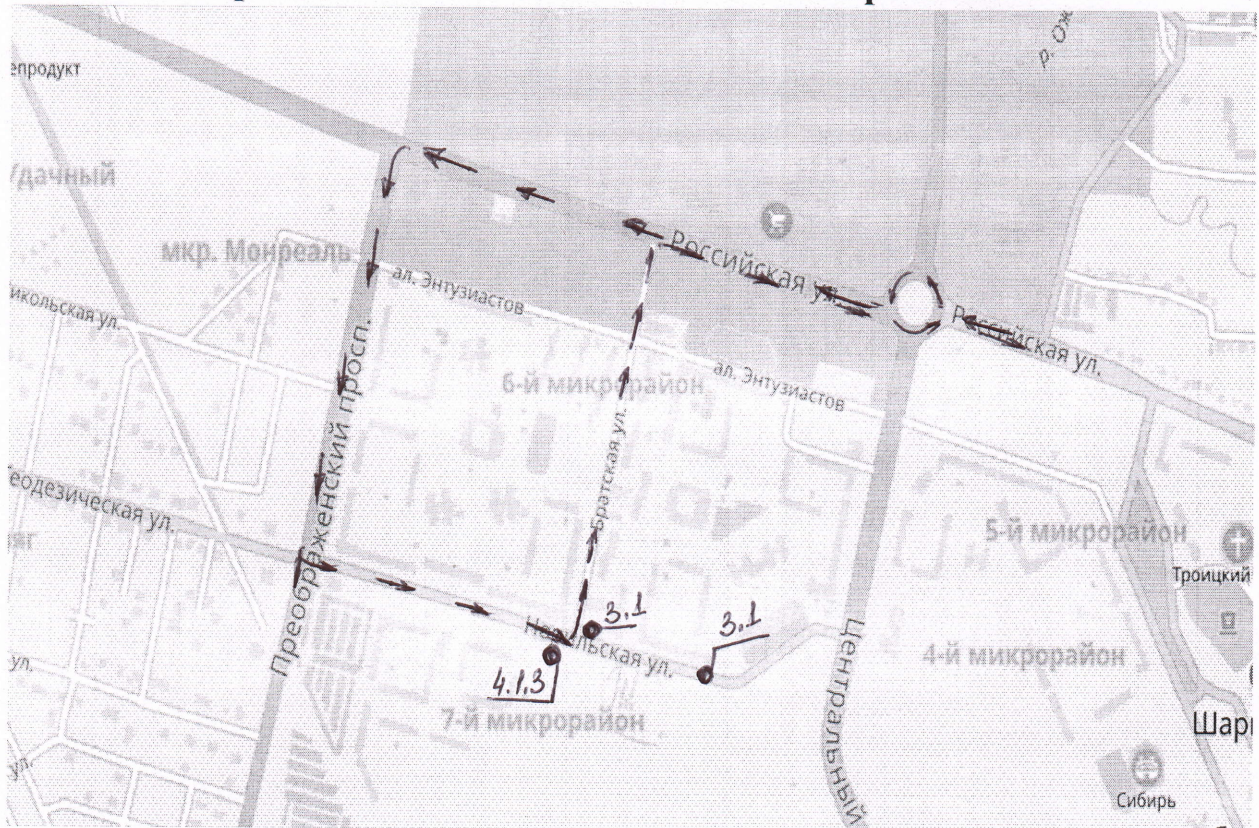
Схема движения автобусных маршрутов № 5,6,7,8 период с 08-00 ч. до 20-00ч. 24 ноября 2018г.