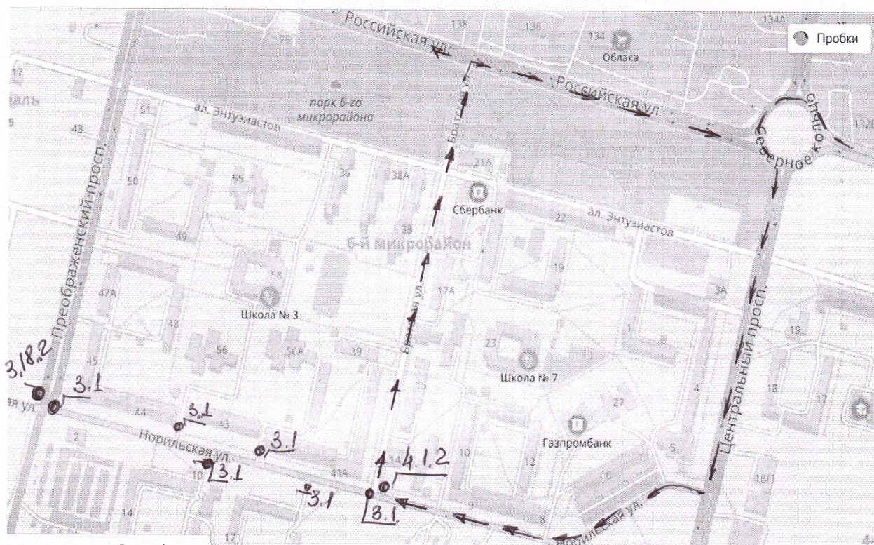
Схема движения автобусных маршрутов № 5,6,7,8 период с 08-00 ч. до 20-00ч. 23 ноября 2018г.

Приложение № 6 к распоряжению Администрации города Шарыпово от «___» _____ 2018г. № _____