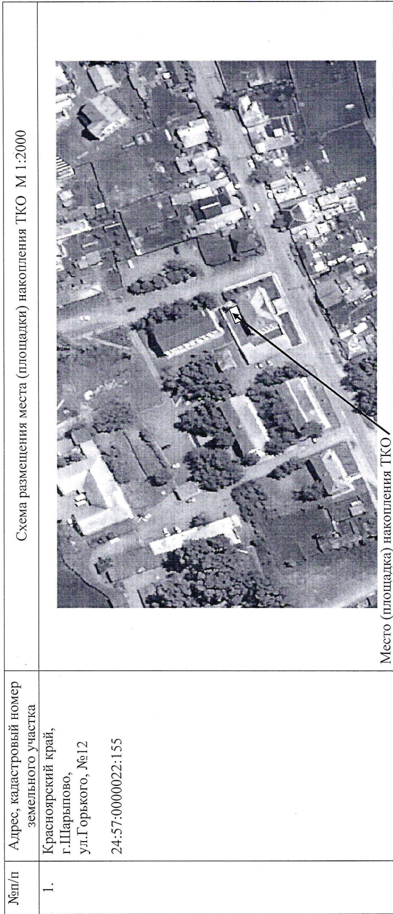
Схема размещения мест (площадок) накопления твердых коммунальных отходов на территории муниципального образования «город Шарыпово Красноярского края»

Начальник отдела архитектуры и градостроительства Администрации города Шарыпово