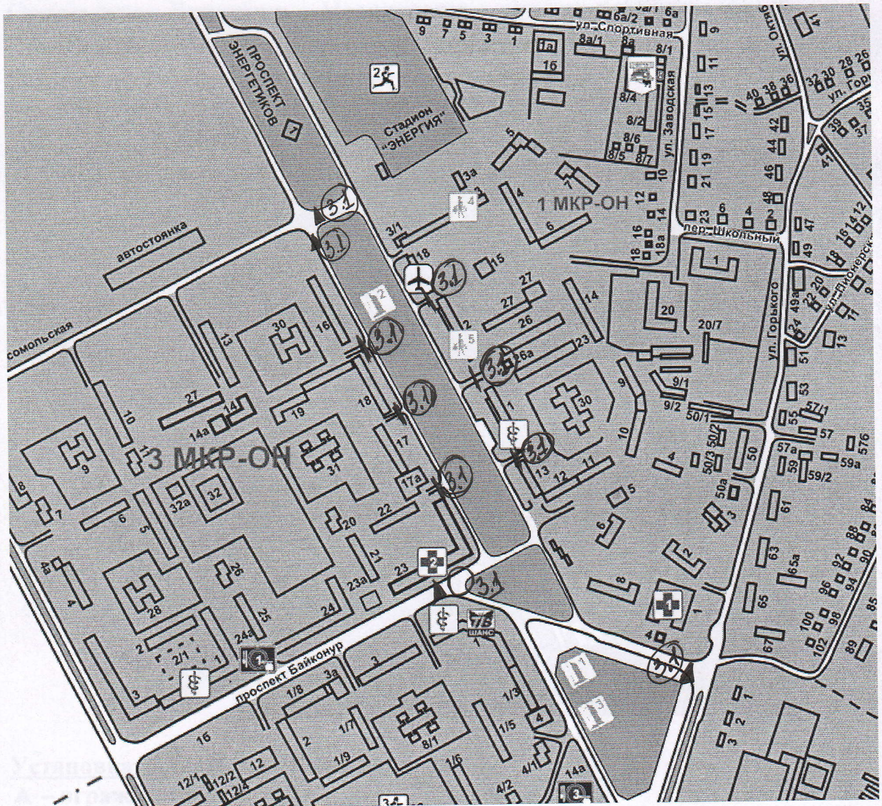
Схема перекрытия автомобильных дорог общего пользования местного значения муниципального образования города Шарыпово 9 мая 2019 года с 9 45 ч. до 15 30 ч.